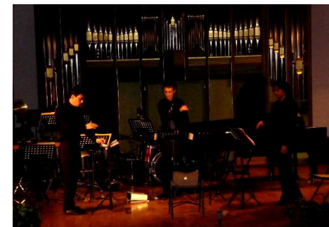
aperghis.play, Bucharest 14.5.2009