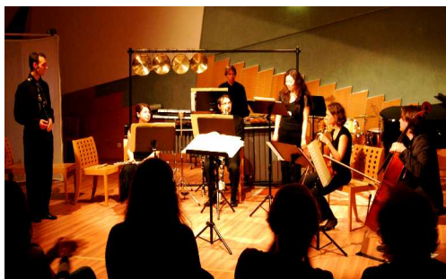
aperghis.play, Wien 6.5.2009