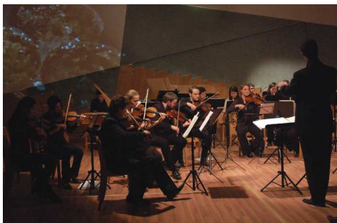
haydn.reflected, Wien 20.2.2009

Kirche Farnosť Sv. Rodiny, Bratislava Reformierte Kirche Fasori, Budapest