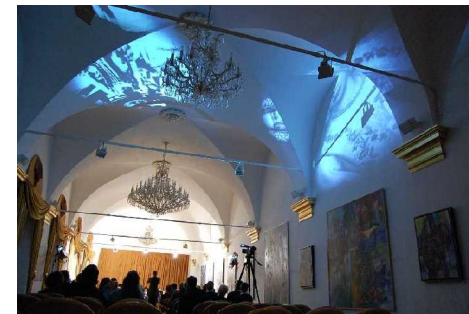
haydn.reflected, Bratislava 21.2.2009