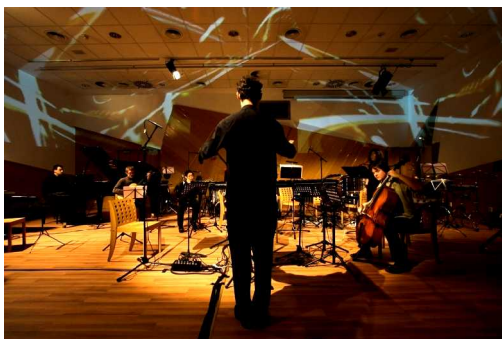
free style hermes, Wien 12.10.2008