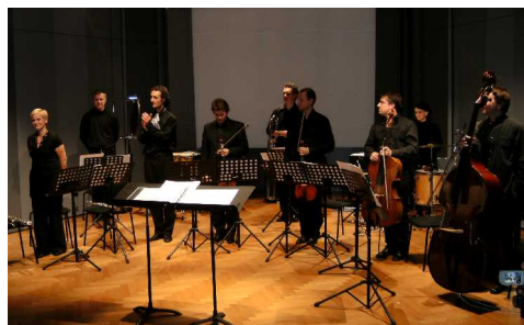
Arnold Schönberg Center, Wien 15.10.2009

Ein europäischer Querschnitt über die Farben der Unterwelt und die Schatten der Oberfläche.